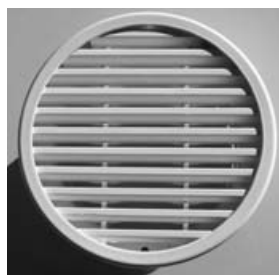
Figure 4 – Bouche de puisage