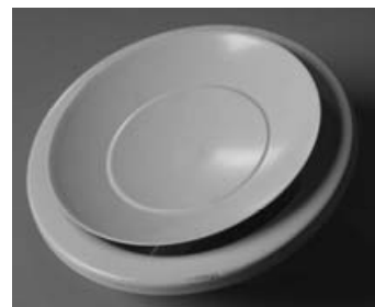
Figure 3 – Bouches de soufflage