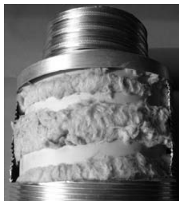
Figure 1 – Conduit souple isolé